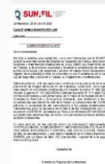
cartas, entre otros